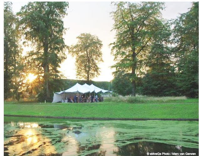
Onze partytent tijdens de midzomernacht

zal de tent effectief kunnen worden ingezet bij concerten en evenementen. De Buitenplaats ziet ook mogelijkheden voor verhuur aan derde partijen.