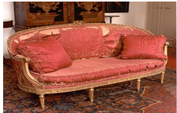
Deel van de Grote Zaal (links) en een hulpbehoevende bank

De vloeren, schouwen, wanden en het plafond zijn in oude glorie hersteld. De conservering van de collectie is ver gevorderd maar nog niet voltooid. Drie grote spiegels en de stoffering, waaronder de bekleding van het achttiende-eeuwse ameublement, moeten nog behandeld worden. Dat laat helaas nog even op zich wachten omdat op dit moment de financiële middelen ontbreken. De Stichting Kasteel Amerongen is daarom zeer verheugd dat de Stichting Vriendenkring Kasteel Amerongen de actie Grote zaal zoekt sponsoren is gestart. Op de komende Vriendenmiddag zal daarom veel aandacht uitgaan naar de Grote Zaal. In de lezingen zal stil gestaan worden bij de bouwhistorie en de conservering van de collectie van deze majestueuze ruimte.