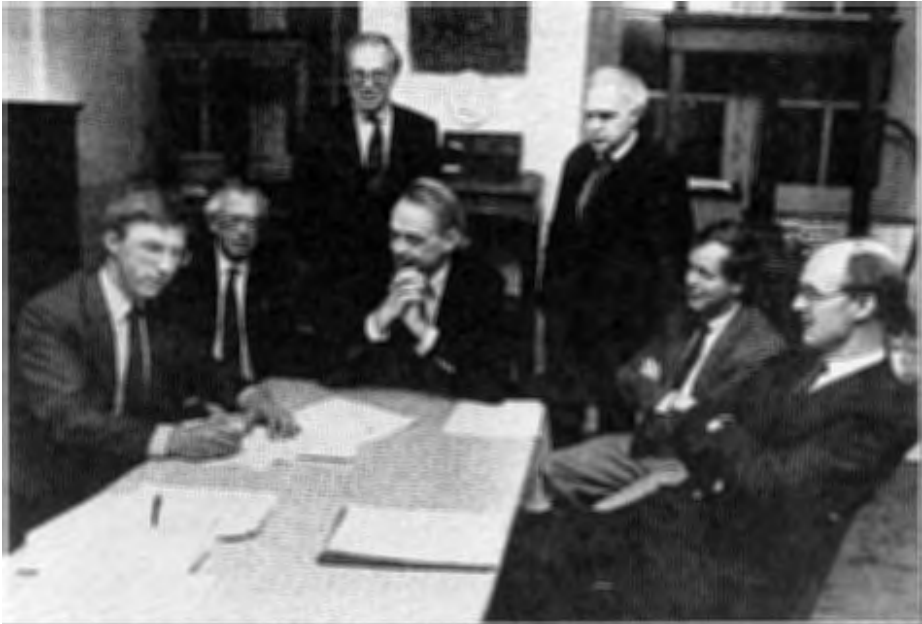
Het grote moment is daar: het ondertekenen van het contract op 't Kasteel.