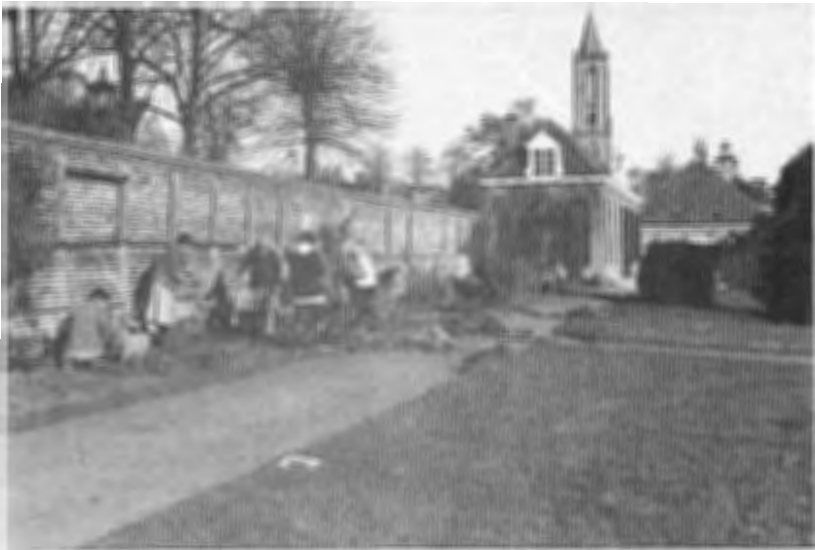
1983 : de eerste vrijwilligers beginnen aan een groot karwei.