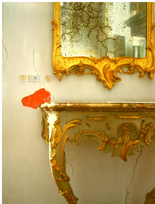
Detail van een van de spiegels

Renée Velsink, restaurateur van lijsten, is gevraagd om de staat van de spiegels in kaart te brengen. De uitkomst was niet geruststellend. De conditie van de spiegels en hun omliggende omgeving is ronduit slecht te noemen. Het hout is aangetast door houtworm wat de draagkracht van de lijsten aanzienlijk heeft verzwakt. De zilverlaag achter het spiegelglas is door vocht gaan bladderen en de opkrullende bladders zijn door oxidatie zwart uitgeslagen.