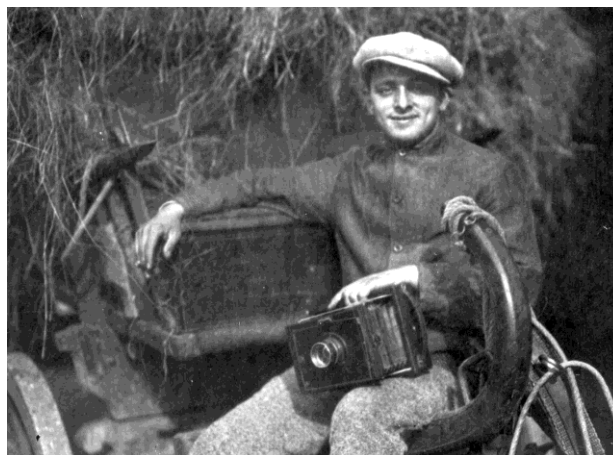
Journalist, verborgen in hooiwagen om een glimp van de keizer op te vangen

Per trein kwam de keizer aan in Maarn. De eerste maanden van zijn verblijf was er veel zorg over zijn veiligheid. (journalisten, risico-aanslagen). Zo was er een Belgische piloot die aankondigde bommen op het kasteel te zullen gooien, waarna het luchtruim boven Amerongen gesloten werd.