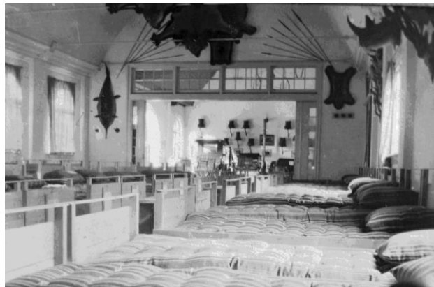
Het Koetshuis, als ziekenzaal anno 1920

Er is alle reden om de toenemende belangstelling voor de eerste wereldoorlog en de periode erna ook voor Kasteel Amerongen te benutten. Er komt een gids waarin de speciale plaatsen in en om het Huis in relatie tot de keizer worden beschreven. We moeten meer (Duitse) bezoekers naar Amerongen trekken en daar kan deze periode aan bijdragen.