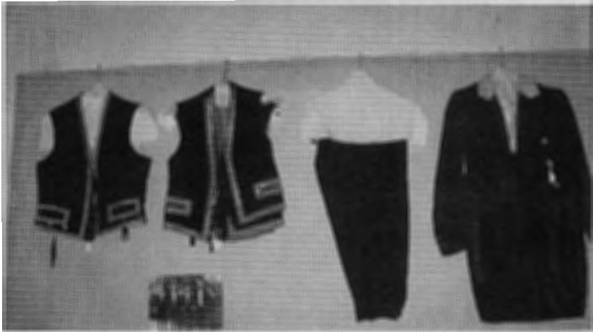
Kleding van de bedienden, gedragen in de tijd van Godard graaf van Aldenburg Bentinck. Vesten, pantalon met speciaal door engelen gemaakt ophangstysteem en een jas, donkerblauw met witte kraag. Originele foto met bedienden in livrekostuum hangt er onder.