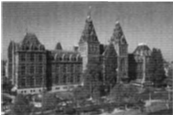
Het Nieuwe Rijksmuseum Amsterdam

Hoofdvesting: Westsingel 9, 3811 BA Amersfoort (033) 463 17 05 (tel.) (033) 461 08 54 (fax) e-mail: bureau@vanhoogevest.nl website: www.vanhoogevest.nl