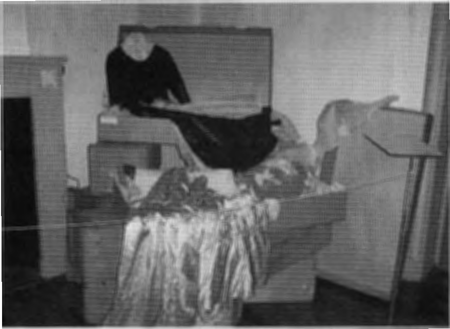
De groene japon, met lijffe en rok los van elkaar. De voorkant van het lijffe loopt uit in een punt. De rok heeft gerimpelde stroken aan de voorkant.

In de hele grote doos zien wij een lambrequin [horizontale draperie tussen twee gordijnen, red.]. Hoe is het mogelijk dat dit object in zo een slechte staat is, terwijl het uit de kamer komt waar wandtapijten al ruim een eeuw schitterend behouden bleven? Restauratie technisch is het nog spannender, want allerlei lijmen en middelen zijn gebruikt om deze lambrequins steeds weer op te lappen. Willen wij dit alles weer ongedaan maken en ze nu goed conserveren? Zo ja, dan zal een chemicus benaderd moeten worden om te onderzoeken of deze lijm nog op te lossen is zonder echter de textiel te beschadigen. Of moeten we kopieën gaan maken? Hoe kan het dat deze optie niet direct als kitsch wordt afgedaan, zoals bij meubilair of schilderkunst? Vragen van ethische aard dus.