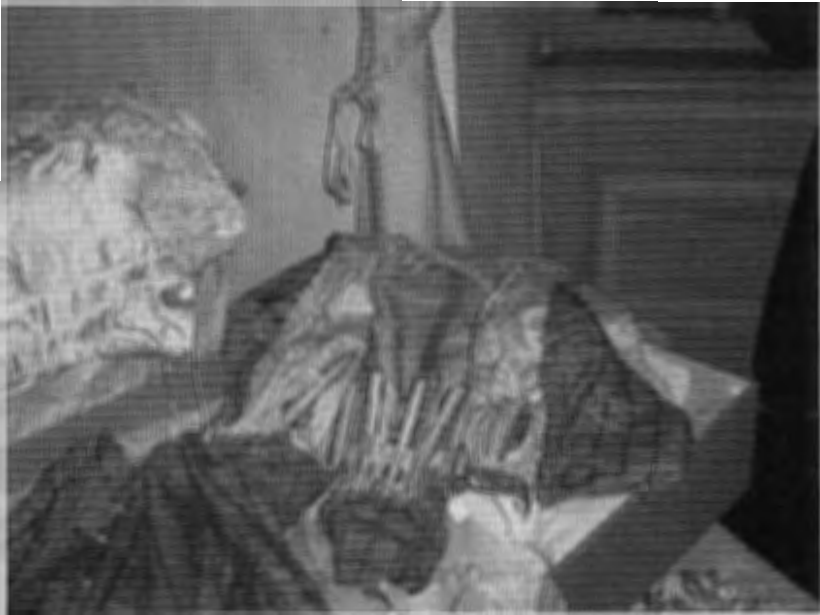
Rose geruite japon: een los lijfje met baleinen; de voering is versleten. Erbij hoort een losse rok. Het ruitpatroon is ingeweven met blauw garen.

Is de rose geruite japon ooit vermaakt, hetgeen zou kunnen blijken uit restanten van deze stof? Voor wie, wanneer, was het spaarzaamheid of om een andere reden? Hoe gaan wij hier mee om? Vragen dus omtrent de geschiedenis van een object.