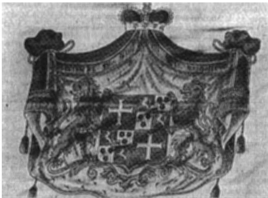
Een opname van het wapen in de witte baan uit de vlag van Kniphausen op het kasteel Amerongen.

De Britse blokkade van de Elbe, Weser en Eems in de jaren 1803 tot 1805 had tot gevolg dat de handelsvloot van het neutrale, onafhankelijke staatje Kniphausen opbloeide. Omdat de Jade niet geblokkeerd werd, verplaatste de gezamenlijke handel van Bremen en Oldenburg zich hierheen. Ook de schepen van Varel, dat, hoewel onder Oldenburg ressorterend, ook bezit van Bentinck was, schijnen de vlag van Kniphausen te zijn gaan voeren. en Varel zelf werd een belangrijke overslagplaats.