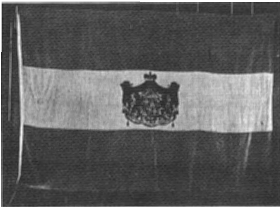
Een afbeelding van de vlag van Kniphausen, uit het boek "Charlotte Sophie Countess Bentinck" door Aubrey le Blond.

Maar nu kwam er verandering. Er verscheen plotseling een eigen vlag, drie banen blauw-wit-blauw met op het midden van de witte baan het familiewapen Aldenburg-Bentinck. Wit en blauw waren van oudsher de Bentinckse kleuren, ontleend aan het wapen: een zilveren ankerkruis op een blauw schild; en zij werden de landskleuren van de heerlijkheid Kniphausen. Wit en blauw werden de kokarde, wit-blauw waren de grenspalen van Kniphausen geschilderd. En nu tenslotte werden wit en blauw de kleuren van de vlag.