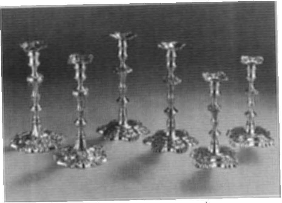
Neo "Lodewijk XV" kandelaren Engeland, begin 20 ste eeuw. Anita Potters, Juwelier-Antiquair, Leersum.