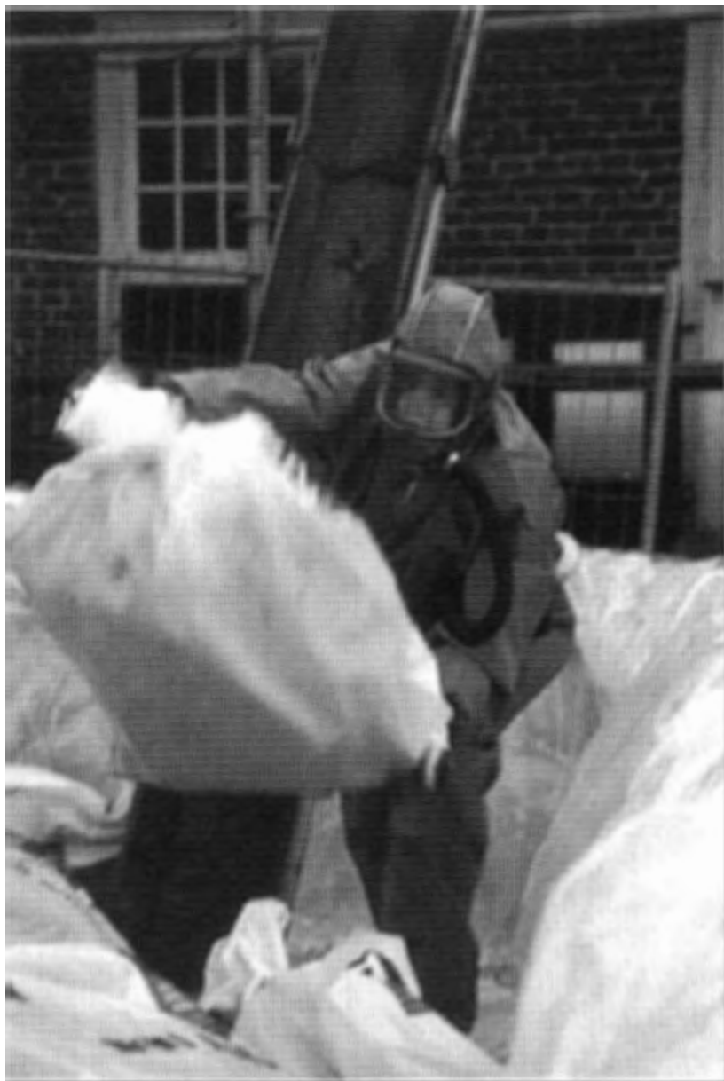
Mannen in beschermende kleding voeren asbest af. Foto: mevrouw G. Blaisse, nov. 2001.