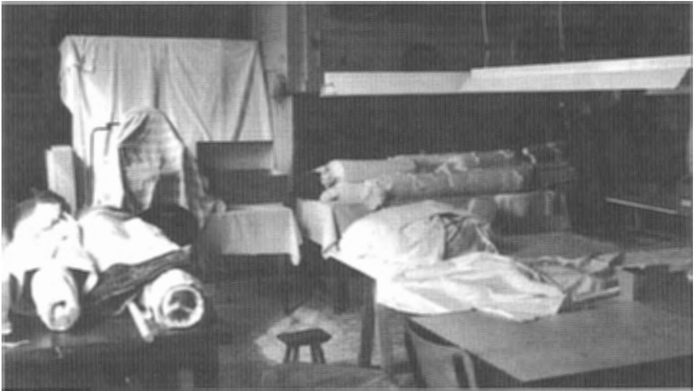
De engelenkamer, waar de conservering van het interieurtextiel gebeurt.