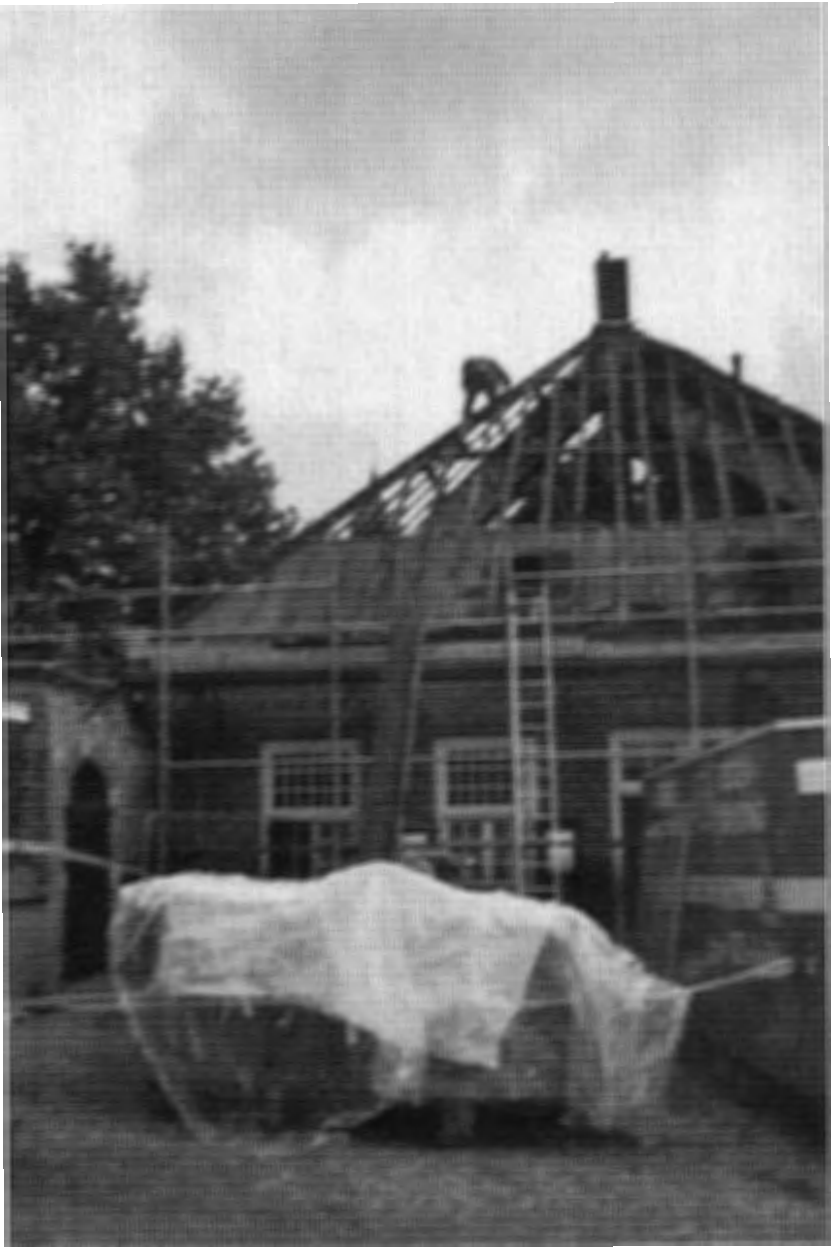
Het asbest wordt verwijderd door een daarin gespecialiseerd bedrijf. Foto: mevrouw G. Blaisse, november 2001.