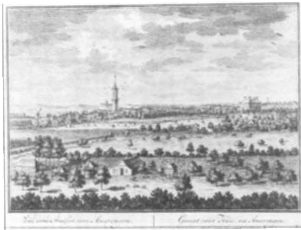
Daniel Stoopendaal Gesicht vant Huis, na Amerongen. kopergravure