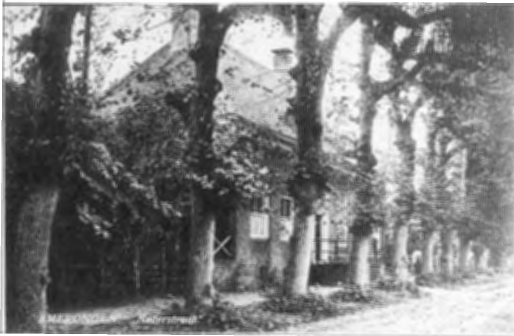
Het huis van de drost, jaartal 1675 van muurankers in de gevel, dus tegelijk met het kasteel gebouwd. Foto 1910?