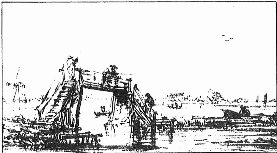
Jan van Goyen (1596-1656) 'Het Bruggetje' 1651 (St. Openbaar Kunstbezit, 4de jaargang, 1960 )