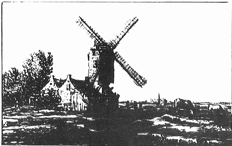
Albert Cuyp (1620-1691) 'De Molen' (St. Openbaar Kunstbezit, 4de jaargang, 1960)